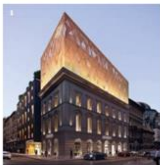
1 Lötvénynek sem utolsó a Nagymező utcai Hard Rock Hotel 2 A WING Boráros téri B & B Hotelének látványterve 3 52 szobás lesz a Wyndham Budapest City Center