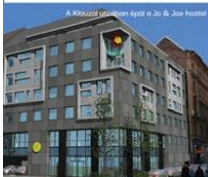
A Klauzál utcában épül a Jo & Joe hostel

úti épületben már folynak az átalakítások. Háromcsillagos superior besorolású szálloda épül a Baross téren, a Keleti pályaudvar tözsomszedságában is. A megbízó a német B&L csoport, amely szállodák és egyéb ingatlanok fejlesztője, és első magyarországi hoteljének a kivitelezésével a magyar DVM Groupot bízta meg. A 312 szobás szálloda